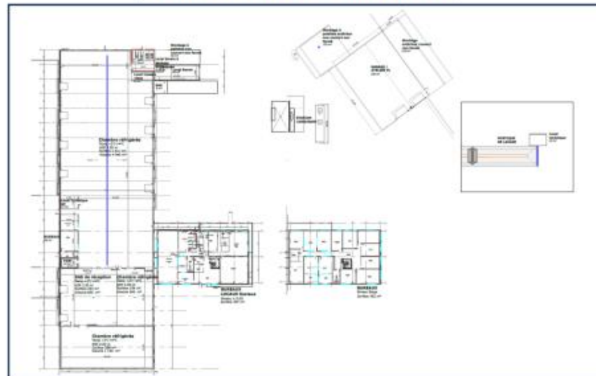
Dénomination des bâtiments