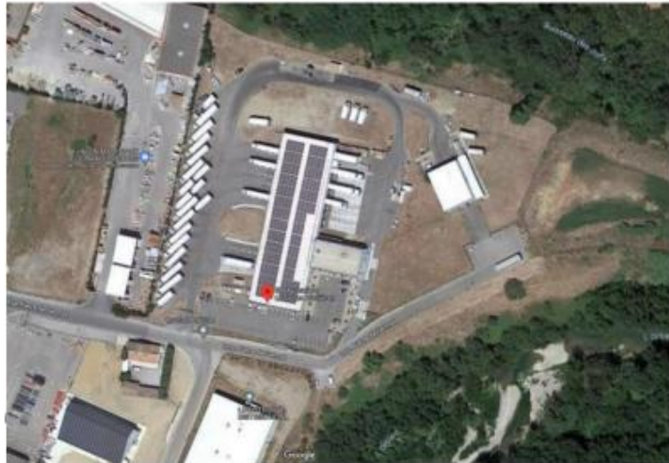
Vue aérienne du site